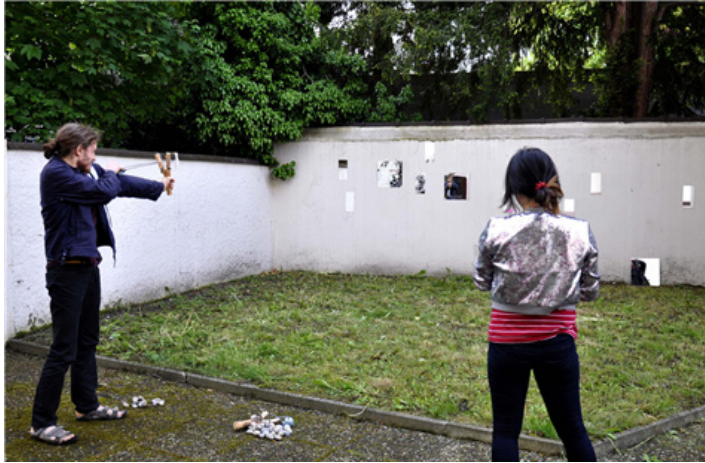
2013년 물루즈에서 르노와 나 (유리작품 : 프랑스 알자스 작가 작품)