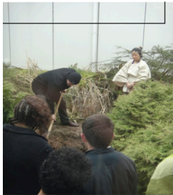
〈Bury Me〉, 2013 프랑스 브장송 예술학교 퍼포먼스, 파리 퐁데자르 갤러리 전시