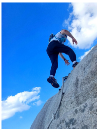
고 마 니 혁명가